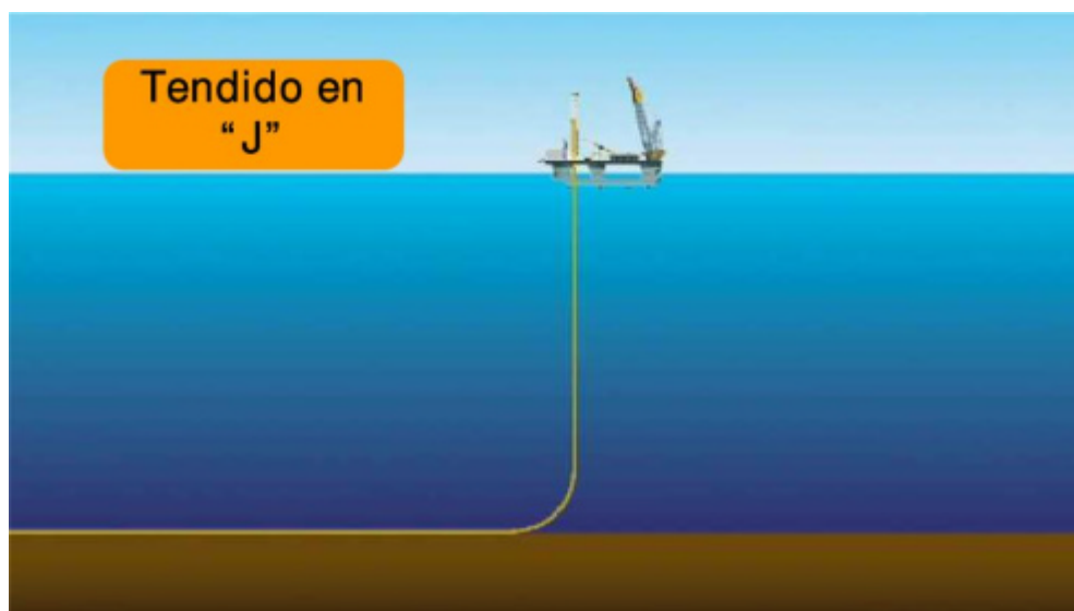
Pose en J

La méthode d'installation utilisée est appelée méthode en J (J-lay) en raison de la forme prise par la tuyauterie au cours du montage. Les tuyaux, soudés au préalable par tronçon de 50 mètres, sont assemblés et installés en position verticale et adoptent une forme en J au cours de leur descente vers le fond marin.